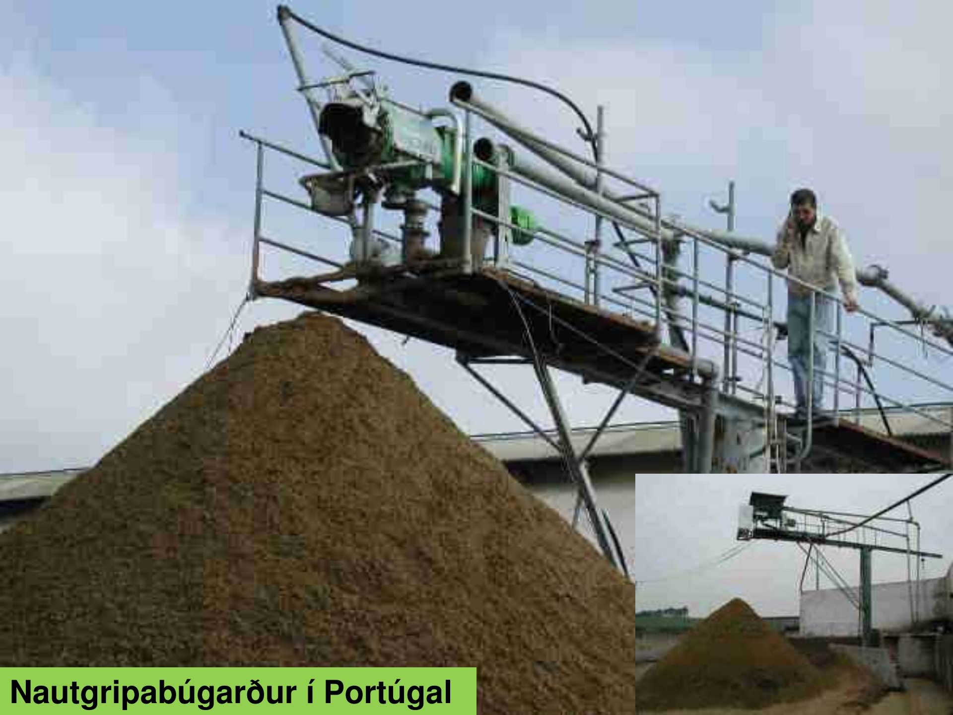
Nautgripabúgarður í Portúgal