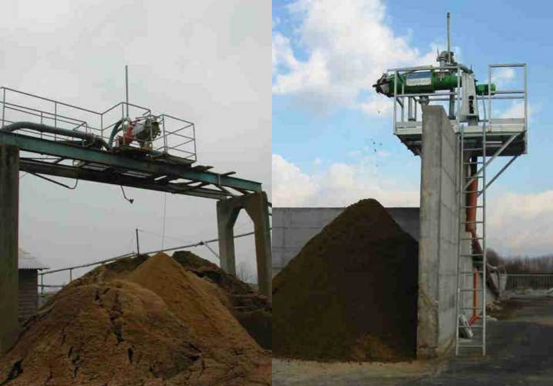
Nautgripabúgarður á Ítalíu